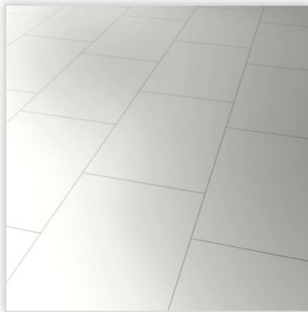
Kolekcja wineo 550 , dekor biały z wysokim połyskiem, symbol LA068CH. Wymiary [mm]: 853/331/8. Wzór: dekor matowy lub błyszczący; 4-stronna mikrofaza. Cechy: wzmocniony papier dekoracyjny hartowany strumieniem elektronów; klasa ścieralności AC4, montaż bezklejowy LocTec.