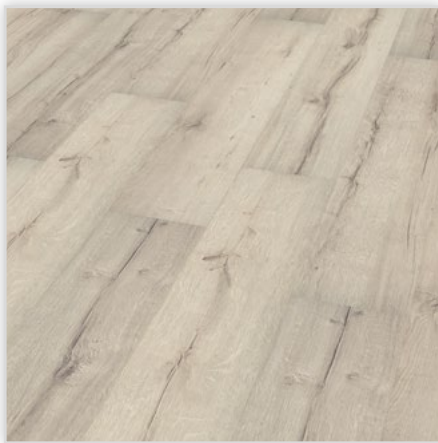
Kolekcja wineo 500 large V2 , dekor Tirol Oak White, symbol LA046LV2. Wymiary [mm]: 1380/246/8. Wzór: pełna deska – powierzchnia Synchron (wyróżne sęki i wyżłobienia), 2-stronna V-fuga. Cechy: płyta nośna Aqua Protect, warstwa antystatyczna, klasa ścieralności AC4, montaż bezklejowy LocTec.