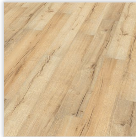
Kolekcja wineo 500 small V4 , dekor Tirol Oak Cream, symbol LA043SV4. Wymiary [mm]: 1380/160/8. Wzór: pełna deska – powierzchnia Synchron (wyróżne sęki i wyżłobienia), 4-stronna V-fuga. Cechy: płyta nośna Aqua Protect, warstwa antystatyczna, klasa ścieralności AC4, montaż bezklejowy LocTec.