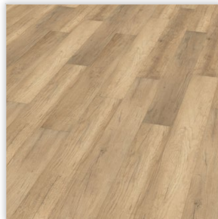
Kolekcja wineo 500 small V4 , dekor Welsh Pale Oak, symbol LA008SV4. Wymiary [mm]: 1380/160/8. Wzór: pełna deska – struktura surowo-piłowana, 4-stronna V-fuga. Cechy: płyta nośna Aqua Protect, warstwa antystatyczna, klasa ścieralności AC4, montaż bezklejowy LocTec.