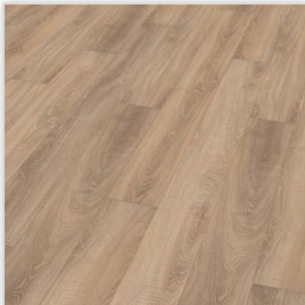
Kolekcja wineo 500 XLV4 , dekor Traditional Oak Brown, symbol LA024XLV4. Wymiary [mm]: 1845/195/10. Wzór: pełna deska – struktura surowo-piłowana, 4-stronna V-fuga. Cechy: płyta nośna Aqua Protect, warstwa antystatyczna, klasa ścieralności AC4, montaż bezklejowy LocTec.