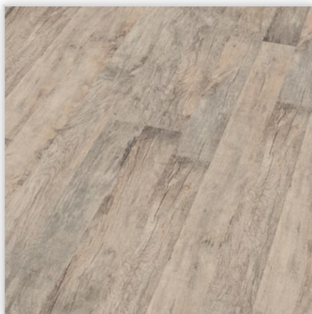
Kolekcja wineo 500 medium , dekor Storm Oak, symbol LA021M. Wymiary [mm]: 1288/195/8. Wzór: 2-deska – struktura surowo-piłowana. Cechy: płyta nośna Aqua Protect, warstwa antystatyczna, klasa ścieralności AC4, montaż bezklejowy LocTec, kolekcja dostępna z podklejonym systemem akustycznym Sound Protect.