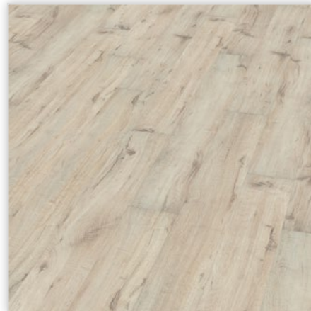
Kolekcja wineo 500 small V4 , dekor Salt Oak, symbol LA047SV4. Wymiary [mm]: 1380/160/8. Wzór: pełna deska – rustykalna struktura matowa (naturalne odcienie i widoczne sęki), 4-stronna V-fuga. Cechy: płyta nośna Aqua Protect, warstwa antystatyczna, klasa ścieralności AC4, montaż bezklejowy LocTec.