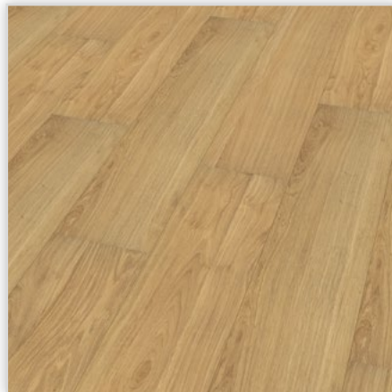
Kolekcja wineo 500 large V2 , dekor Oak Champagne, symbol LA051LV2. Wymiary [mm]: 1380/246/8. Wzór: pełna deska – rustykalna struktura matowa (naturalne odcienie i widoczne sęki), 2-stronna V-fuga. Cechy: płyta nośna Aqua Protect, warstwa antystatyczna, klasa ścieralności AC4, montaż bezklejowy LocTec.